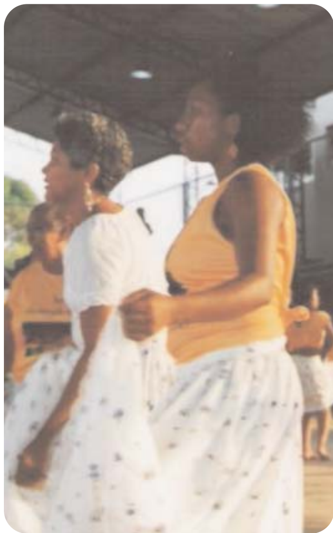
Mulheres de um quilombo dançam o marabaxo; tradições culturais como essa difundem a mensagem da igualdade racial.

O lançamento da secretaria marcou a entrada do movimento negro na administração pública. A detentora da pasta, Matilde Ribeiro, é ex-militante, negra e feminista. E ela não é a única que carrega um passado de ativismo, pois outros membros são oriundos de organizações como Geledés e Fala Preta!.