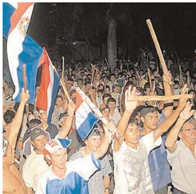
Manifestación contra la presencia militar en Paraguay.

Sin embargo, todo indica que Estados Unidos busca posicionarse en la Triple Frontera. Muchos funcionarios de ese país vienen señalando desde la década de 1990 que es un lugar “peligroso”. En octubre de 2005, el director del FBI, Robert Muller, afirmó en Asunción